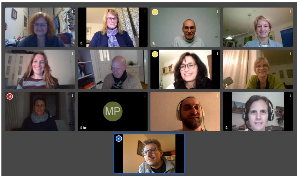
Digitalfoto der letzten EB-Sitzung

PS: Die Eltern-Infobriefe sind auf der Homepage des Elternbeirats zu finden. Im passwortgeschützten Bereich – Passwort wie bei der Schul-Homepage. www.elternbeirat-rupprecht-gymnasium.de