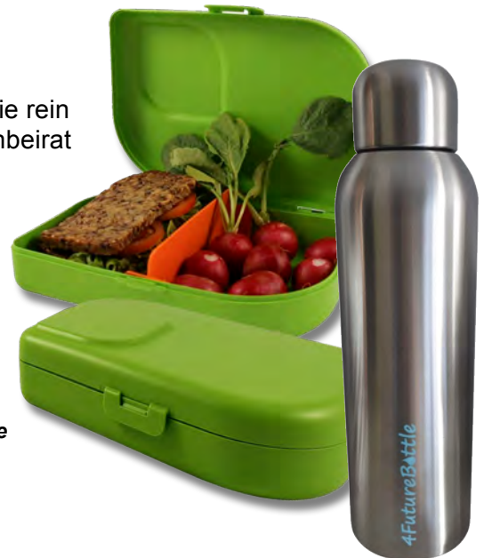
Nana-Box und 4FutureBottle