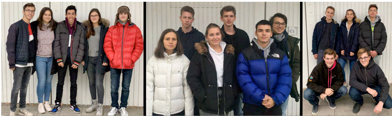
Drei engagierte Teams der Q11

Die Anmeldung läuft bis Mitte Februar 2020. Weitere Infos: https://www.business-at-school.net/ww3ee/9.php#/ww3ee/initiative.php?sid=87299486149851787255043844384290