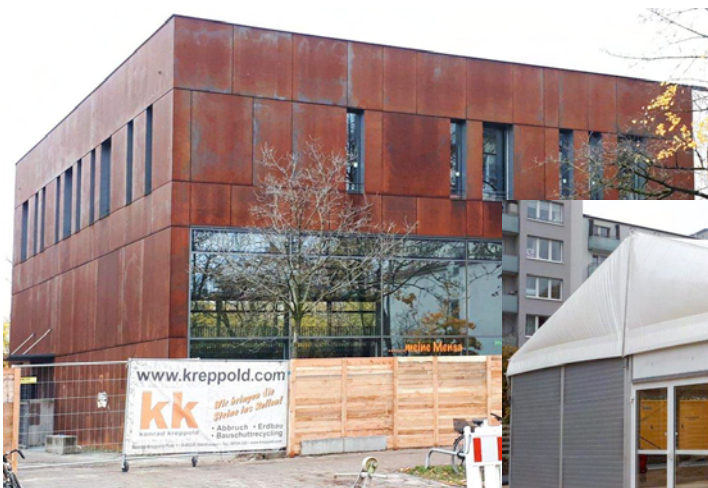
Die bisherige Mensa und die Interimsmensa

Die Mensa wird Zug um Zug abgebaut. Die tiefergelegte Turnhalle wird auch entfernt und dann beginnt der Bau der beiden Neubautrakte. Wie sicherlich viele schon bemerkt haben, ist die derzeitige Interimsmensa sehr klein. Leider handelt es sich hierbei um eine Notlösung, da sich die ursprüngliche Planung verzögert hat. Die eigentlich geplante Interimsmensa kann erst im nächsten Jahr eingerichtet werden. Die ersten Wochen wurden mit einigen Einschränkungen bei der Essensversorgung gemeistert, inzwischen sollte es reibungsloser funktionieren. Die Essensausgabe wird mit vier Leuten gemacht, es konnten zusätzliche Plätze geschaffen werden und das AWG geht zu anderen Zeiten zum Essen. Die Auswahl bleibt allerdings dieses Schuljahr bei zwei Essensmöglichkeiten. Die Mensabetreiberin, Frau Gunselmann, muss auswärts kochen und das Essen anliefern. Weitere Nachbesserungen sind im Gespräch. Für die vier Klassenzimmer, die sich über der alten Mensa befanden, wurde ein eigener Container errichtet. Mittags können zwei Räume davon von der Oberstufe genutzt werden.