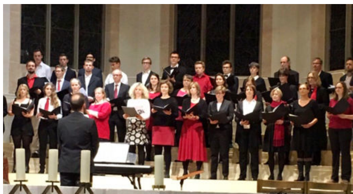
Lehrerchor mit Schülerunterstützung