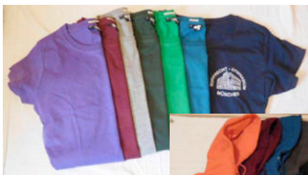
Rupprecht-Outfits am EB-Stand

Weihnachtliche Stimmung mit Plätzchen, Musik und liebevoll aufbereiteten Waren für den guten Zweck