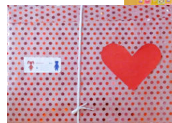
Geschenke mit Herz