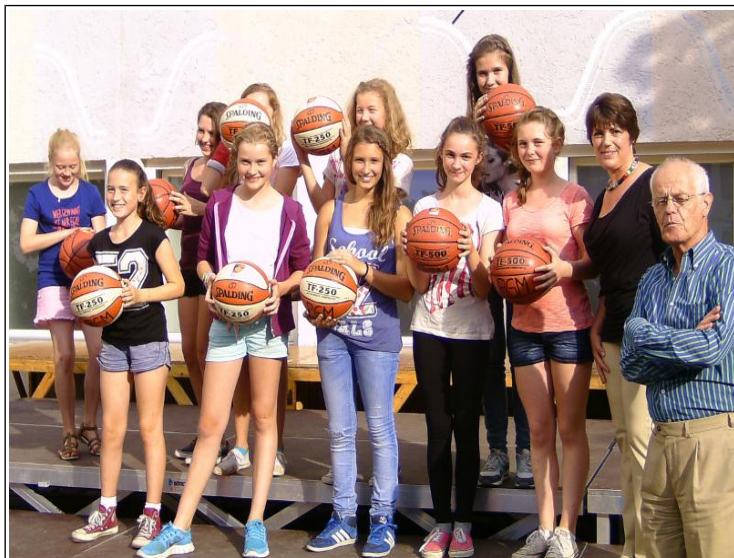
Der Verein "Freunde des Rupprecht-Gymnasiums" übergibt Basketballbälle an die Schule.

Am 24. Juli konnten wir bei wunderschönem Wetter das Sommerfest feiern. Auf Grund der Mithilfe vieler Eltern in Form von Essensbeiträgen und Mitarbeit an den Ständen wurde es wieder ein großer Erfolg. Wir möchten uns bei allen Eltern für die vielen Beiträge und die Mitarbeit an den Ständen bedanken! Hier ein paar Impressionen vom Sommerfest: