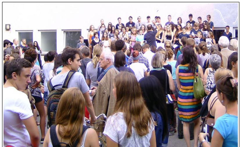
In der Projektwoche wurde ein Musical einstudiert.